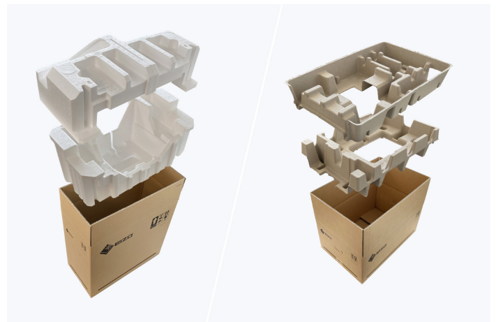
Links: conventionele verpakking / Rechts: milieuvriendelijke materialen

Voor de verpakking van het MX217-HB gebruikt EIZO een vulling van cellulose. Het materiaal is gemaakt van gerecycleerd karton en papier, en heeft een veel geringer milieueffect wanneer het wordt weggegooid dan traditioneel polystyreen of plastic. Alle kabels worden opgeborgen in een kartonnen compartiment in plaats van in plastic zakken.